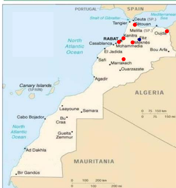
Taux de croissance